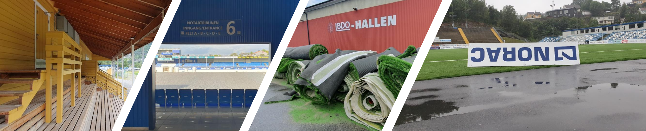
Hellesylt Stadion, Nordmøre Stadion/BDO-Hallen, Kristiansund og Norac Stadion, Arendal