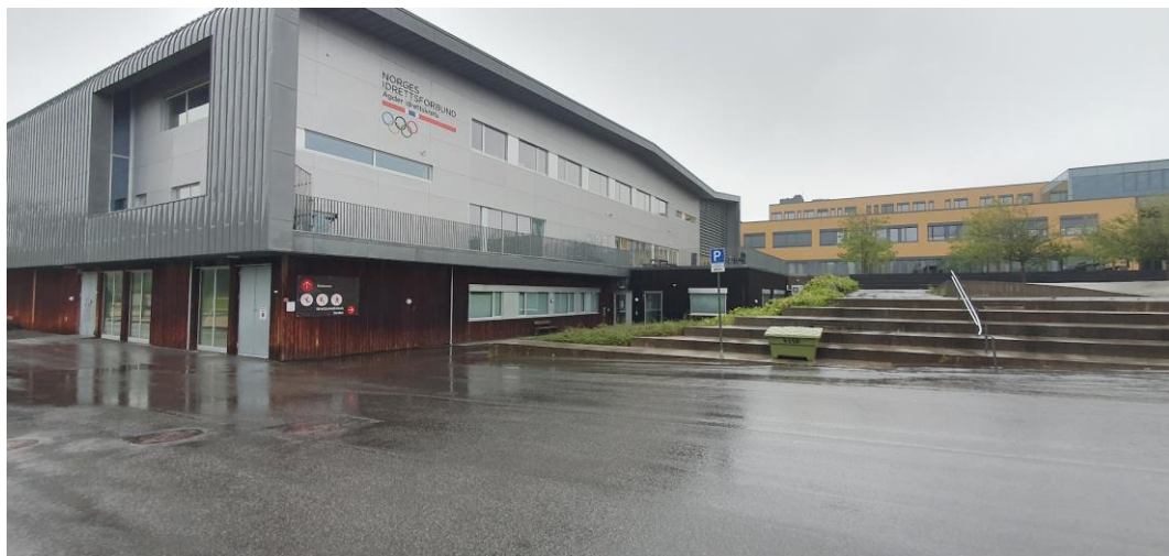
Sør Amfi, Arendal og Granåsen skisenter, Trondheim